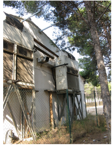
Equipos clima. Fachada norte