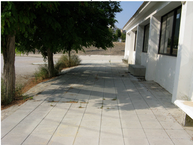
Acera fachada principal