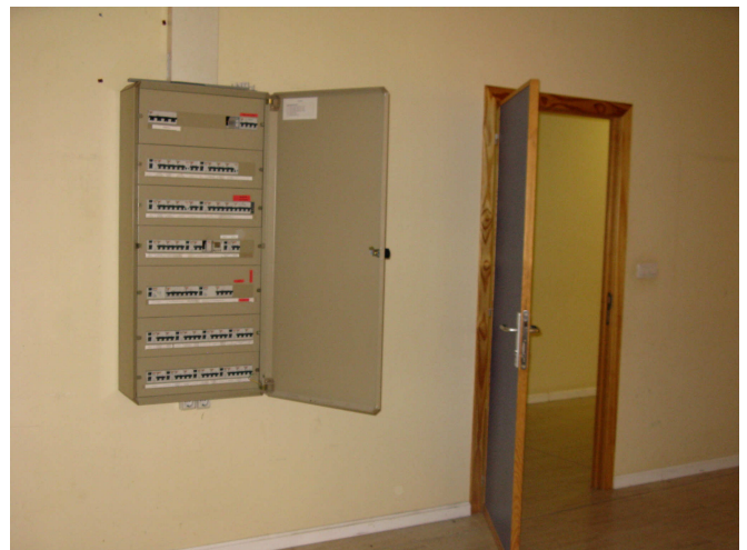
Cuadro general energía eléctrica