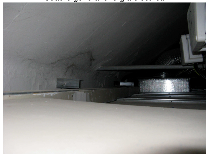
Intradós bóveda y tirante acero