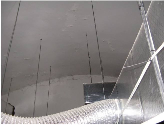
Cara interior hastial