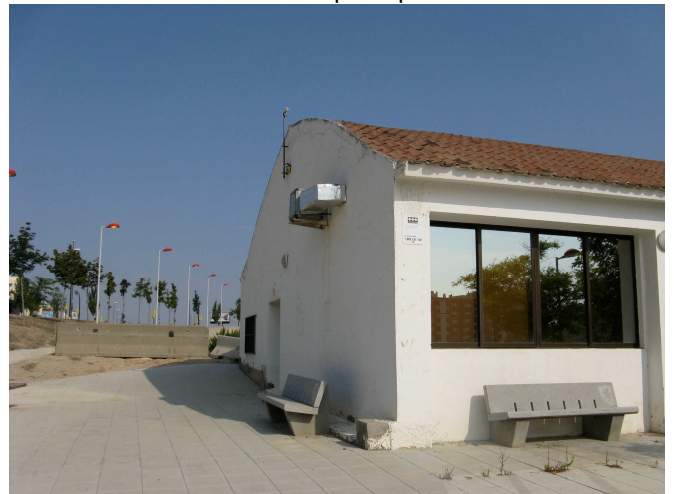
Fachada sur - este