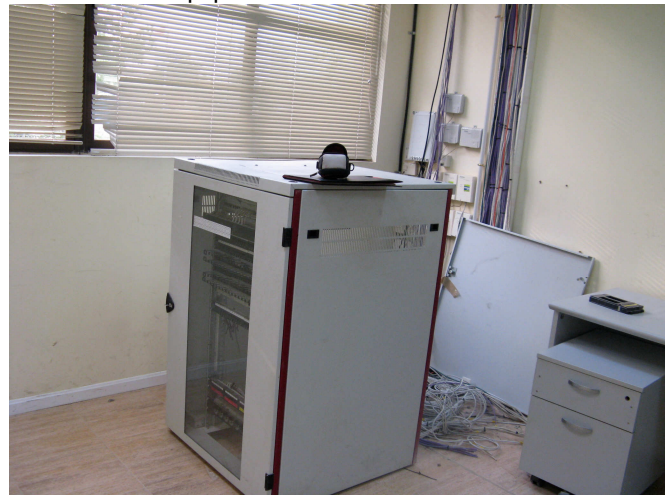
Armario RAC comunicación