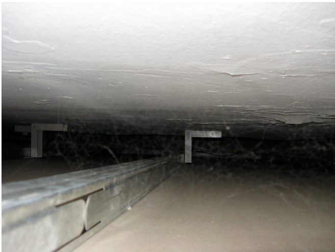
Cámara entre tabique cartón yeso y muro ext.