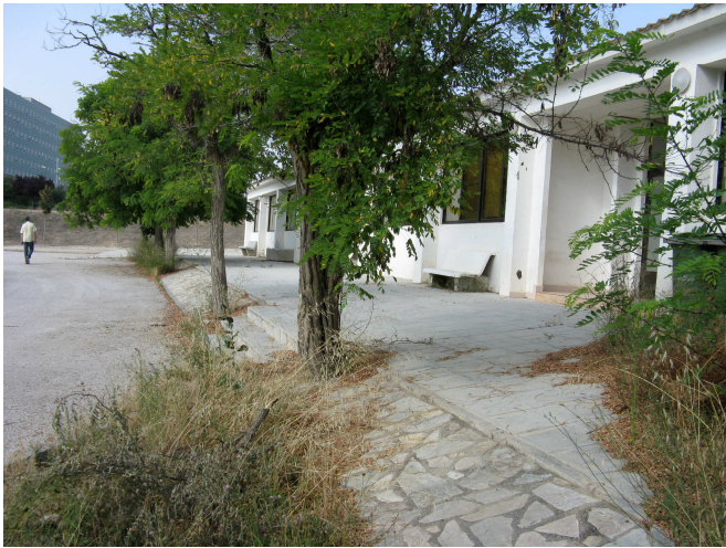
Fachada principal este